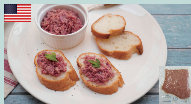
コンビーフ100g 100gあたり 1,200円(税込1296円) 「脂っこくなくておいしい！」と評判です。パンにのせるだけでオードブルに。