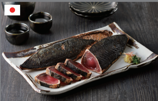
焼津式かつおのたたき 鬼わら焼き 2本 1,112円(税込1,200円)

焼津港で水揚げした新鮮なカツオを目利きのプロとして活躍する社員が選別し、中は凍ったまま表面だけ焼きました！通常品よりもむねを増量しじっくり時間をかけて焼き上げ、香りが良く旨味を閉じ込めました！