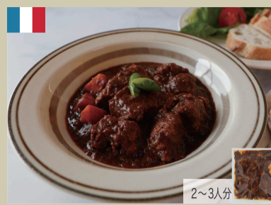
赤ワイン風味ビーフシチュー 500g 1,850円(税込1,998円)

ロース肉を低温でじっくり加熱しローストポークに仕上げました。隠し味にニンニクで下味を付けていますので食欲をそそります。