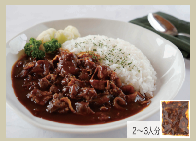
ハッシュドビーフ 500g 1,400円(税込1,512円)

十数時間煮込むのでホロホロに柔らかく食べられます。ソースをフランスパンにつけてお召し上がりください。赤ワインがアクセントです。