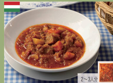
ガーシュ 500g 2,000円(税込2,160円)

モルディブ人が食べているカツオのカレー。刺身鮮度のカツオを使い、パンダナスリーフやカレーリーフをはじめ沢山のスパイスを使ったココナツ風味のソースで煮込みます。隠し味にカツオの荒節を入れるのもモルディブ流です。