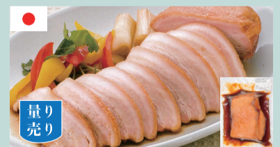
豚ばらチャーシュー 100gあたり 260円(税込280円) (目安) 1パック=1,000円~1,600円 400~600g/パック

焼津の網元 人とのつながりを大切に、地元でも評判の本当においしい食材を集めました。さらにどの商品にも物語と作り手の誇りがあります。ぜひ、本物の焼津産海幸をご賞味ください。