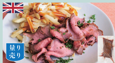
ローストビーフ 100gあたり 470円(税込507円) (目安) 1パック=1,400~3,000円 300~600g/パック