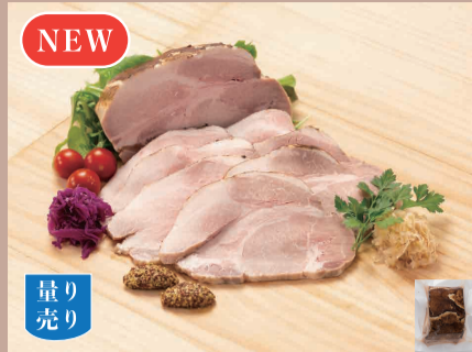
ローストポーク 900g~1.3kg 100gあたり 300円(税込324円) (目安) 1パック=2,700~3,900円

豚のヒレ肉をこだわりの西京味噌で漬け込みました。解凍後、カットするだけで豪華なおードブルの完成です！