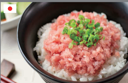
天然まぐろ 三種の生たたき 80g×4袋 1,000円(税込1,080円)

「かつおの概念が変わった！」と評判です。 カツオ タタキとの相性抜群！！ 深い海の塩 あらしお 375円(税込405円)