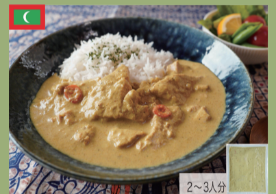
マス・リハ(カツオカレー) 1,800円(税込1,944円)

細切りにした仔羊肉とグリーンピースのホクホクした食感とほのかな甘みが心地よくマイルドな味になっています。