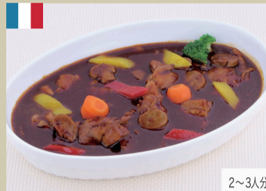
若鶏の赤ワイン煮 500g 1,300円(税込1,404円)

牛バラ肉とタマネギを専用のデミグラスソースで煮込みました。ご飯やバターライスなどと相性が良いです。