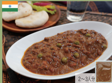
インド羊仔キーマカレー 500g 1,800円(税込1,944円)

細切りにした仔羊肉とグリーンピースのホクホクした食感とほのかな甘みが心地よくマイルドな味になっています。