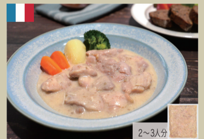
きご風味のチキンシチュー 500g 1,300円(税込1,404円)

赤ワイン風味のデミグラスソースは、マッシュポテトやチーズなどと相性が良いのでグラタンにするのもおすすめです。