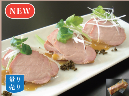
ポークヒレロースト味噌漬け 約500g 100gあたり 350円(税込378円) (目安) 1パック=2,000円

豚のヒレ肉をこだわりの西京味噌で漬け込みました。解凍後、カットするだけで豪華なおードブルの完成です！