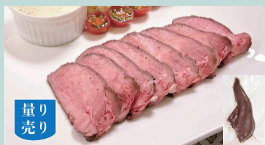
ニタンロースト 100gあたり 700円(税込756円) (目安) 1パック=4,200~5,000円 600~700g/パック