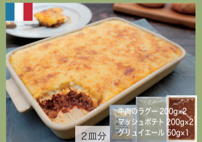
アッシ・パルマンディエ 3,600円(税込3,888円)

ハンガリー大使館の全面協力により、さらに美味しくなりました！牛バラ肉をハンガリー産の甘いパプリカパウダーやトマト・ニンジン・ジャガイモ・パプリカと一緒に煮込んだハンガリーの国民食。遊牧民が鉄鍋で煮込んだのがルーツです。